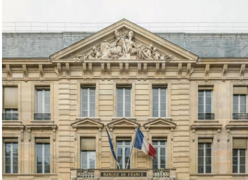
Hôtel de Toulouse