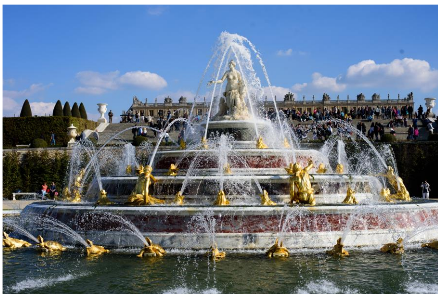
Фонтан в Версале