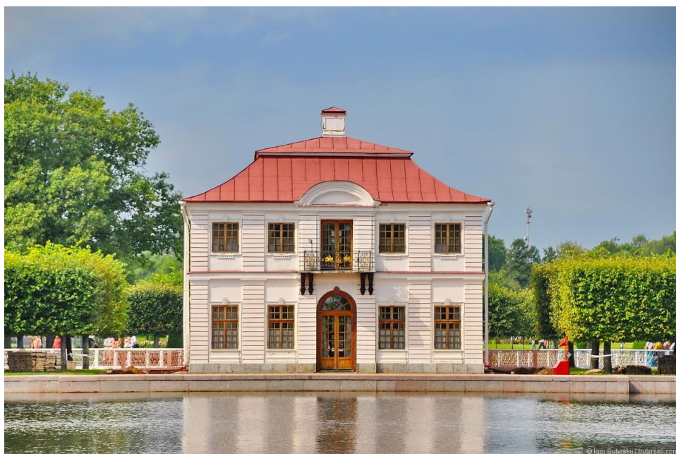
Дворец Марли в Петергофе

Но в петергофском ансамбле Марли оказались позаимствованными лишь общие композиционные решения и отдельные элементы французской резиденции. Они были органично объединены с традициями русского садово-паркового искусства.