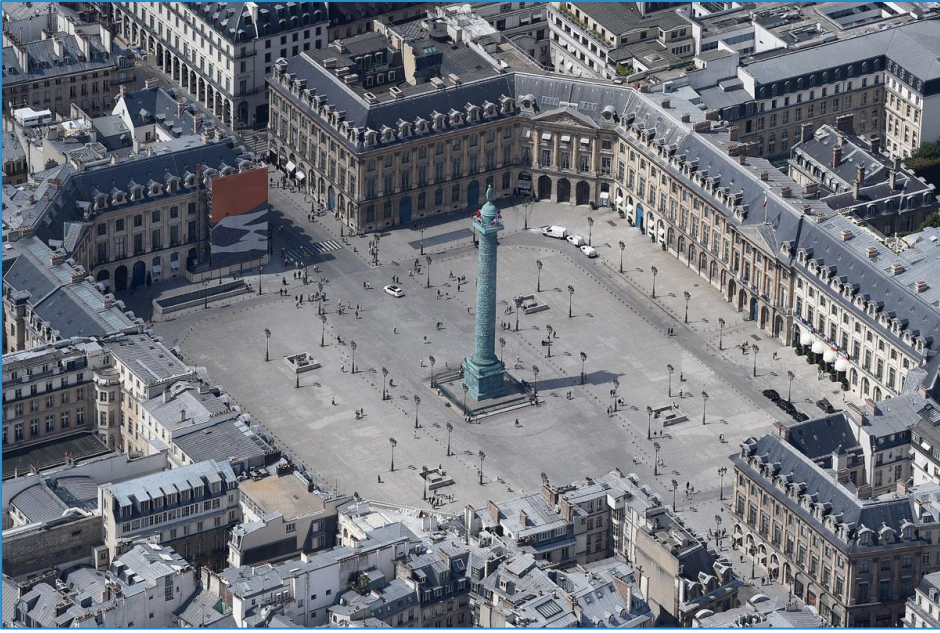
Université de Paris (Sorbonne Université)