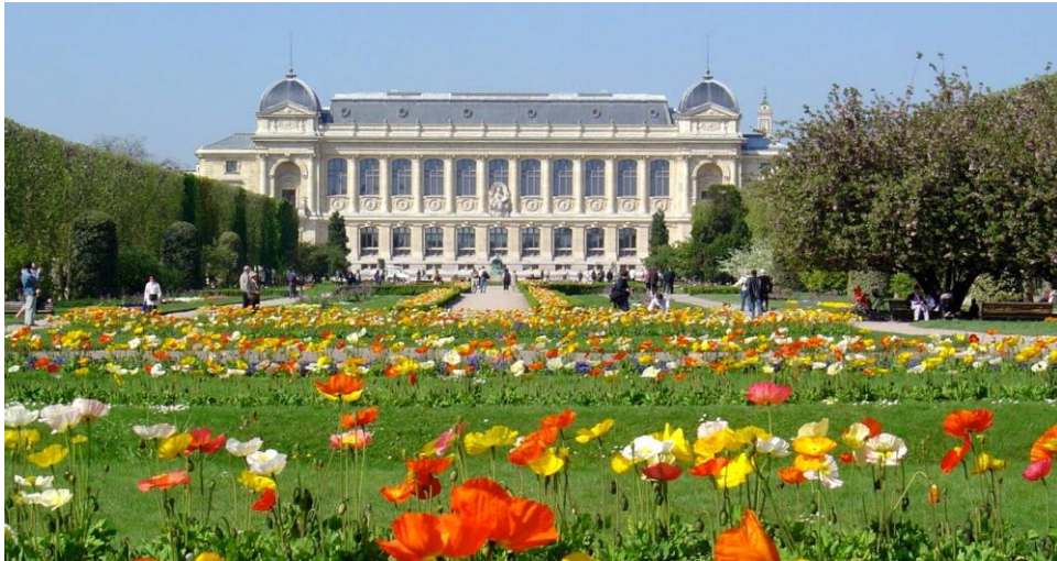
Jardin des Plantes