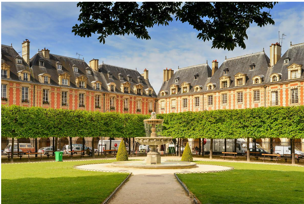
Place des Vosges