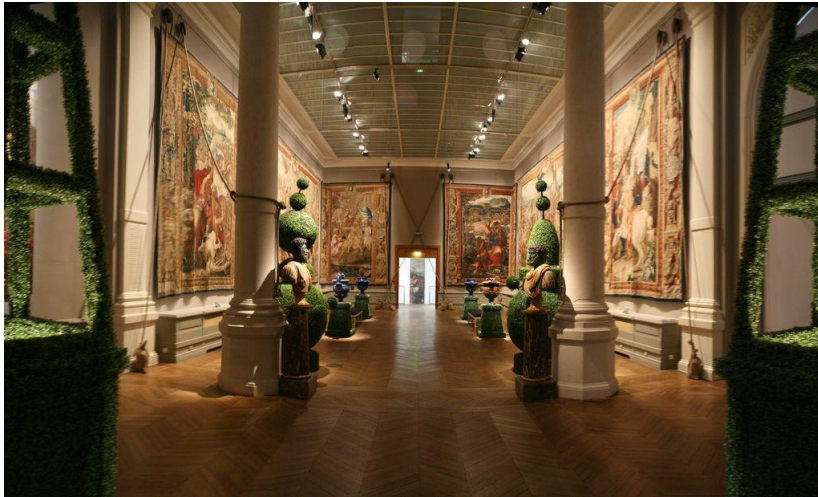
La Manufacture nationale des Gobelins Hôtel des Invalides