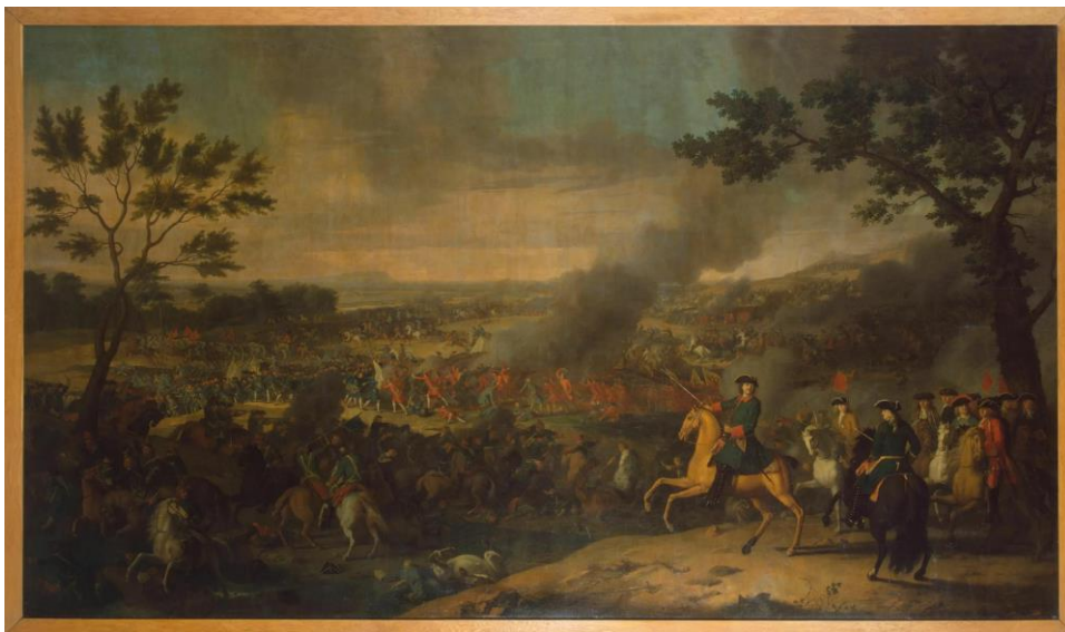
Louis Caravaque Battle of Poltava