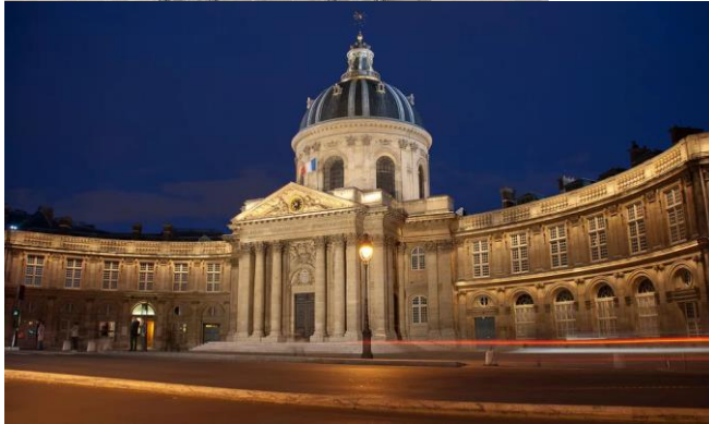
Collège des Quatre-Nations

2. В Париже Пётр не только осматривал достопримечательности. каждый день он знакомился с работой двух-трёх