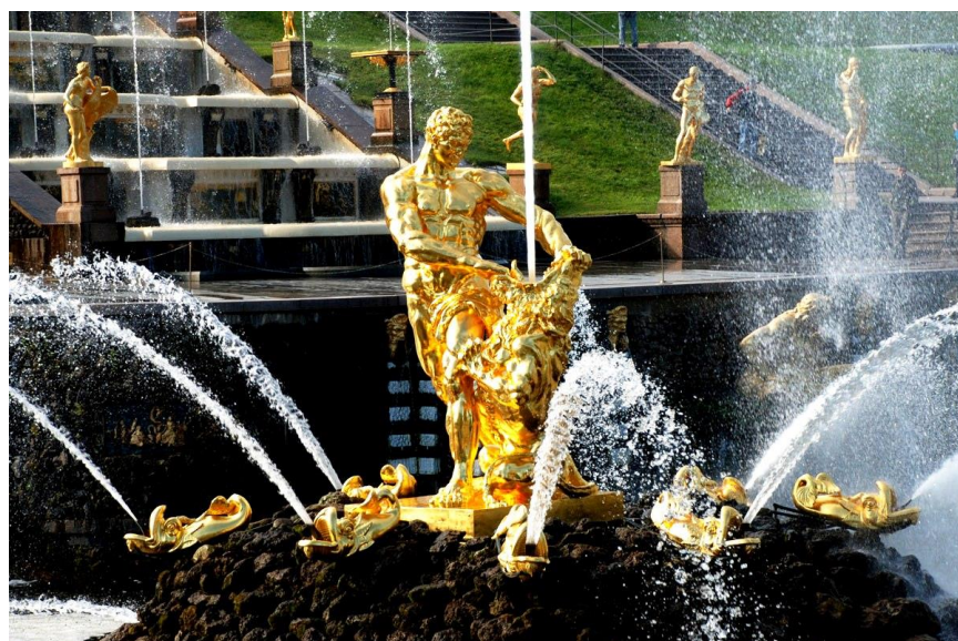
Фонтан в Петергофе