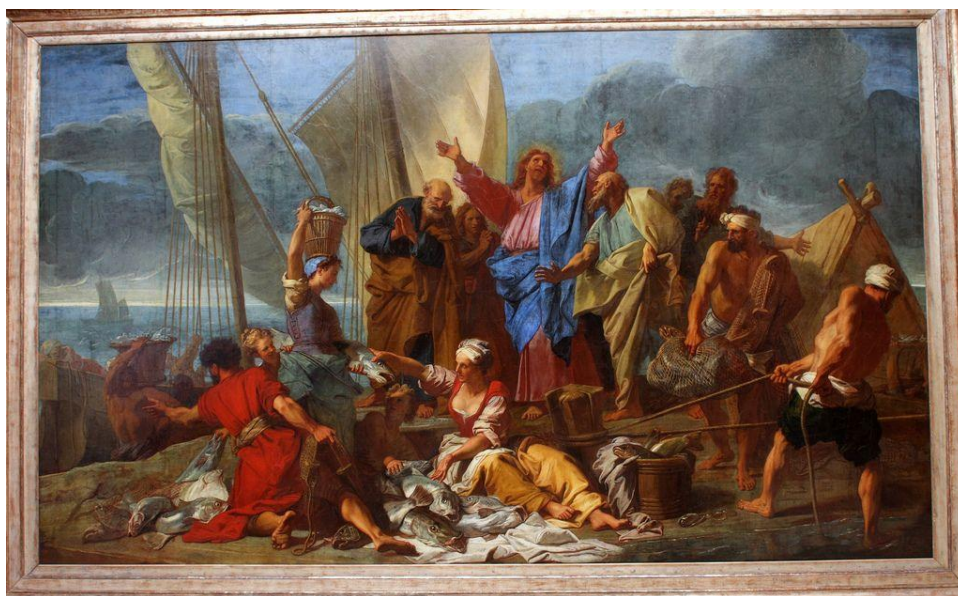
La pêche miraculeuse

Гобелен (gobelin с фр.) - один из видов декоративного искусства, стеной односторонний безворсовый ковер с сюжетной или орнаментальной композицией, вытканый вручную перекрестным переплетением нитей. Термин “гобелен” стал синонимом изначального итальянского понятия “шпалера” (spalliera с итал.) В эпоху Возрождения слово “шпалера” означало “спинка кровати”, “спинка скамьи”, “настенное украшение за мебелью”. Со временем значение “шпалеры” как настенного украшения поменялось, и слово стало означать стеной ковер без ворса. Примером шпалеры (гобелена) может стать большой ковер La pêche miraculeuse , изображенный на фото.